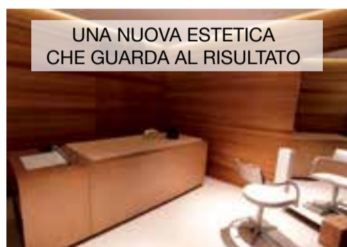
UNA NUOVA ESTETICA CHE GUARDA AL RISULTATO

In un momento di cambiamento così profondo nel settore della medicina estetica e della cosmesi si pone sempre più l'imperativo di garantire, assieme ai punti chiave della qualità del servizio, atmosfera, relax e benessere, il risultato nei trattamenti di bellezza.